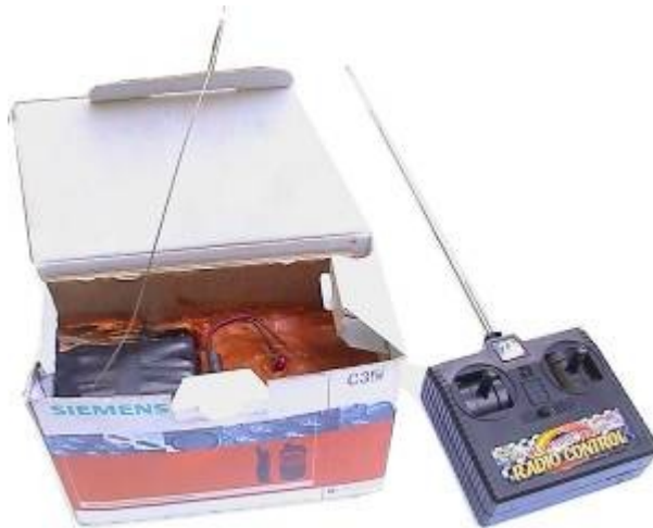
Примеры маскировки СВУ