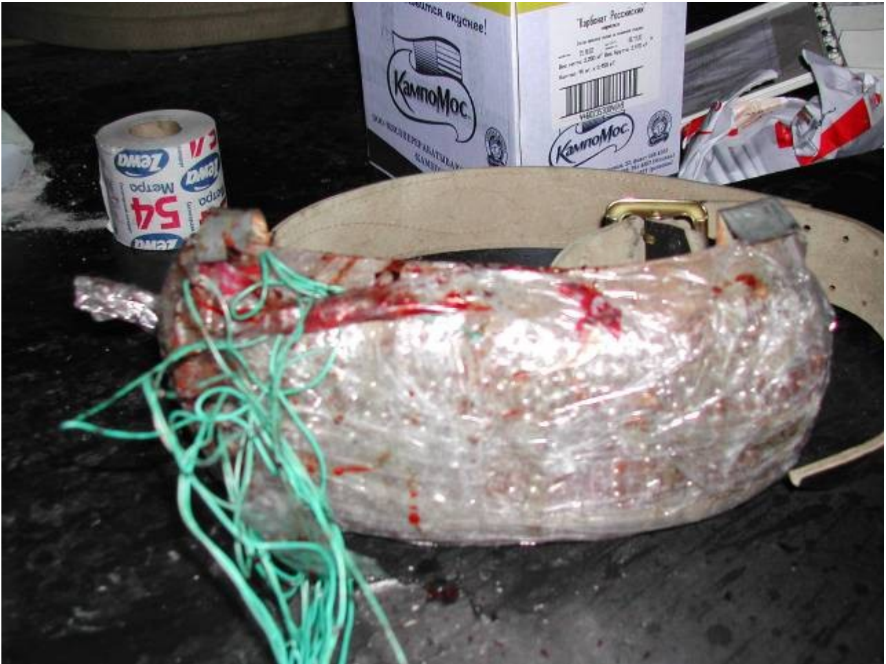
Взрывное устройство, крепящееся на теле террориста-смертника