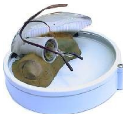
Самодельное взрывное устройство в световых плафонах