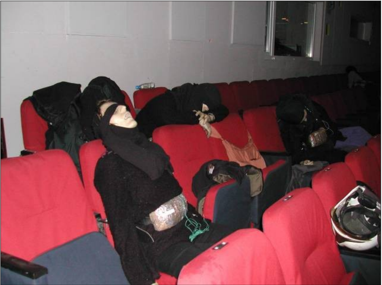
Террористки-смертницы, участвовавшие в захвате заложников в Москве («Норд-Ост»)

могут не подозревать, что они заранее отнесены к числу жертв и используются «в темную» по воле других людей в качестве «контейнеров» и средств для доставки взрывчатки к цели. При таком способе организации террористической акции исполнителю ставится задача оставить в назначенном месте взрывчатку или сумку, о содержимом которой он может не знать, а в лучшем случае лишь догадываться, но при этом данный участник террористической акции не ставится в известность о том, что его дальнейшая судьба предрешена.