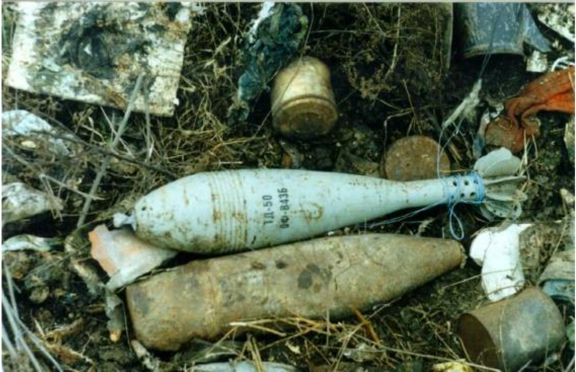
Самодельное взрывное устройство на основе штатных боеприпасов