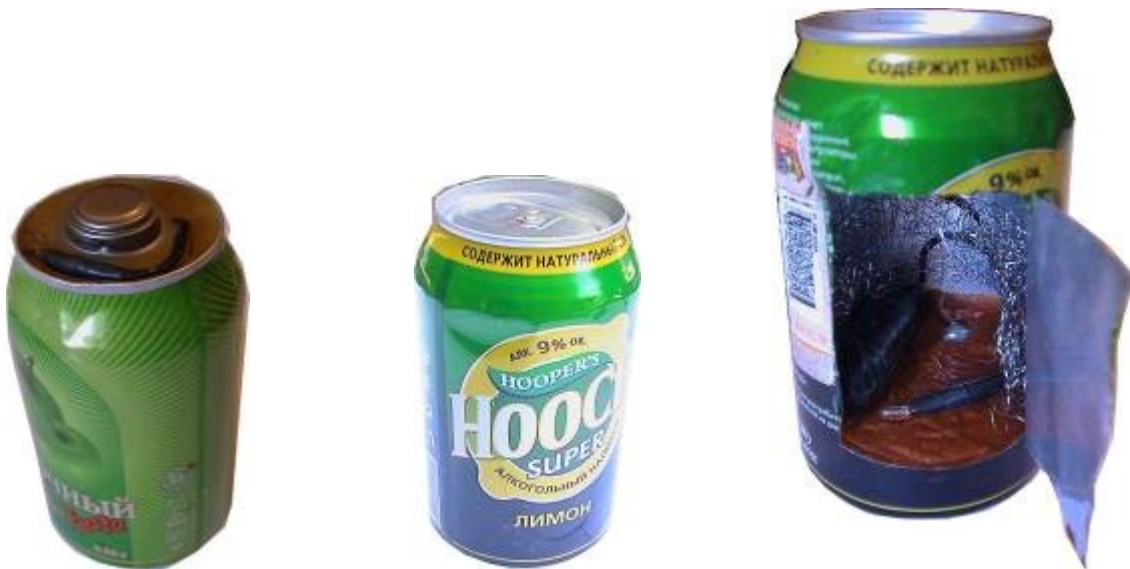
Самодельные взрывные устройства в банках из-под напитков